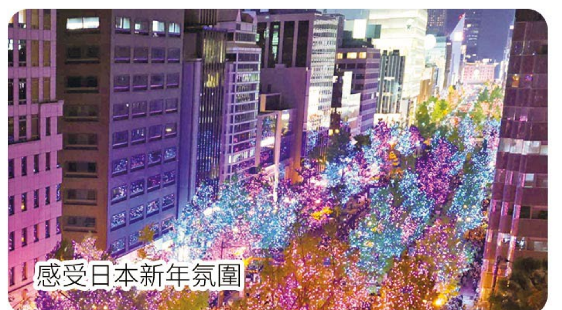
感受日本新年氛圍