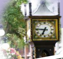
煤氣鎮 - 蒸氣鐘

Morning commence Vancouver city tour to Gastown, Canada Place, Winter Olympic Park, Capilano Suspension Bridge Park, Stanley Park, Chinatown and Granville Island. Early afternoon proceed to Queen Elizabeth Park.